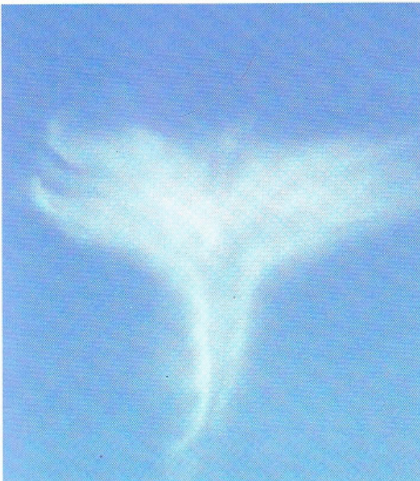
Camden, VS, 2016

Toen we ons huis in het hart van de Franse Pyreneeën kochten, vertelde de makelaar een spannende legende over een Witte Dame die zich in het verleden af en toe had laten zien bij het oude château waarop we uitzicht hebben. Omdat ik een boek over witte spookdames heb geschreven, was ik natuurlijk een en al oor. Regelmatig werpen we een blik op het kasteel dat onderwerp is van verschillende legenden in onze regio. Op een dag gebeurde er iets dat onze wereld even op zijn kop zette.