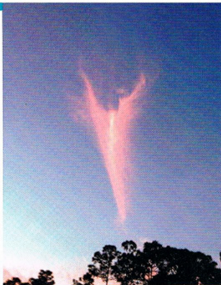
Royal Palm Beach, VS, 2013